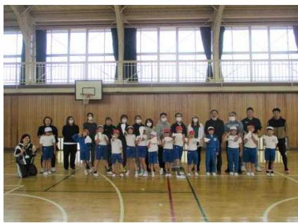
【2年:紙ひこうき飛ばし】11/6