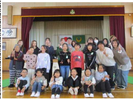
【3年:ニュースポーツ】11/7